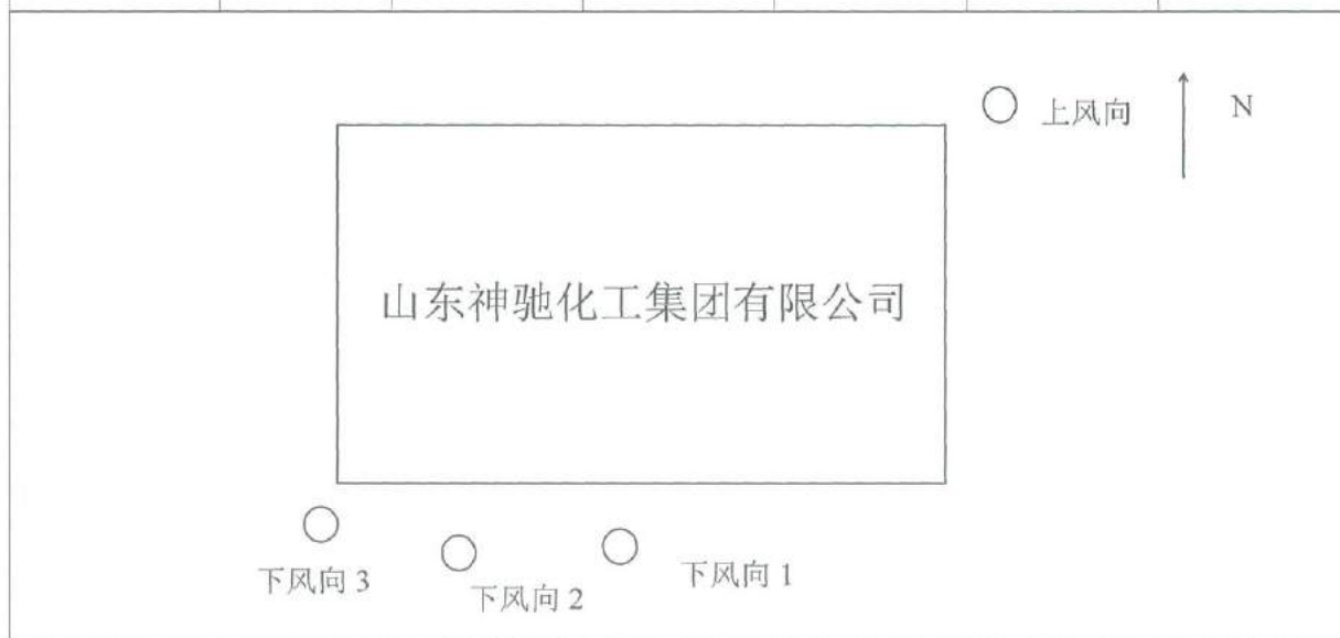
图1 无组织废气采样布点图