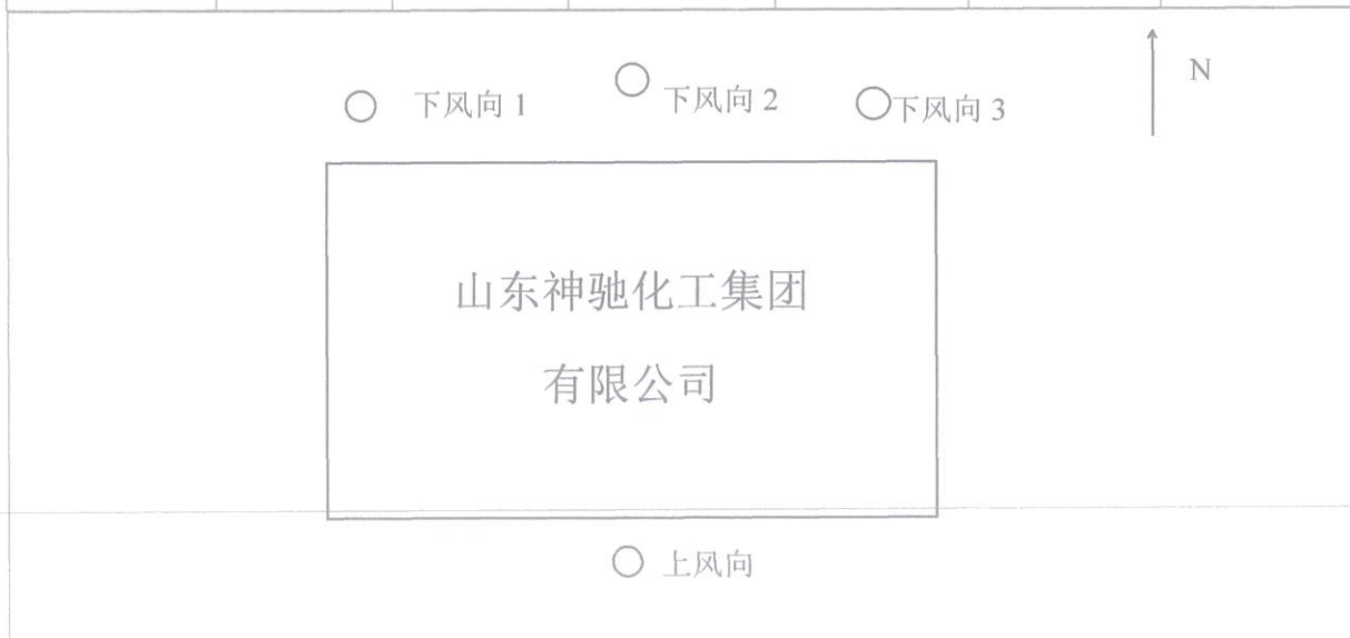
图1 无组织废气采样布点图